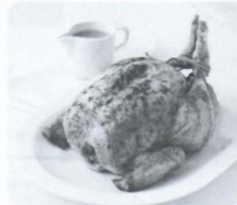
5 _____ chicken