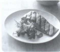
1 grilled salmon