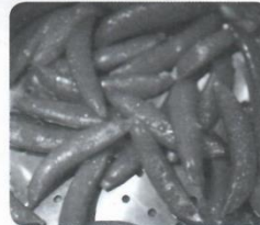
6 _____ peas