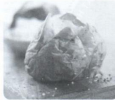
3 _____ potato