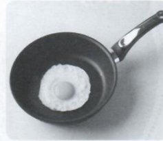
4 _____ egg