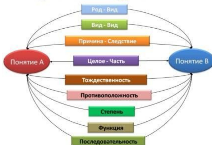
Рисунок 2: Виды логических связей между понятиями