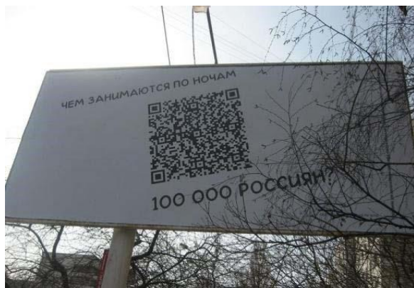
Рис. 5 информационную нагрузку. Вербальный компонент призван лишь возбудить интерес адресата, в то время как полнота желаемой информации будет получена только после «прочтения» QR кода. С точки зрения рекламодателей, визуальная информация не нужна или, скорее всего, не может быть размещена из цензурных соображений. Но это не влечет за собой потери информативности, при использовании гиперссылки адресат узнает все необходимое.

Ниже приведены примеры, иллюстрирующие вытеснение традиционных компонентов креолизованного текста гиперкодом. При рассмотрении фотографии билборда на рис. 5 первое, что хочется прокомментировать, — отсутствие иконического компонента. Тем не менее возможно и следует говорить о семиотически осложненном, креолизованном тексте. Вербальная часть в данном случае не сможет существовать автономно от гиперкода, несущего основную