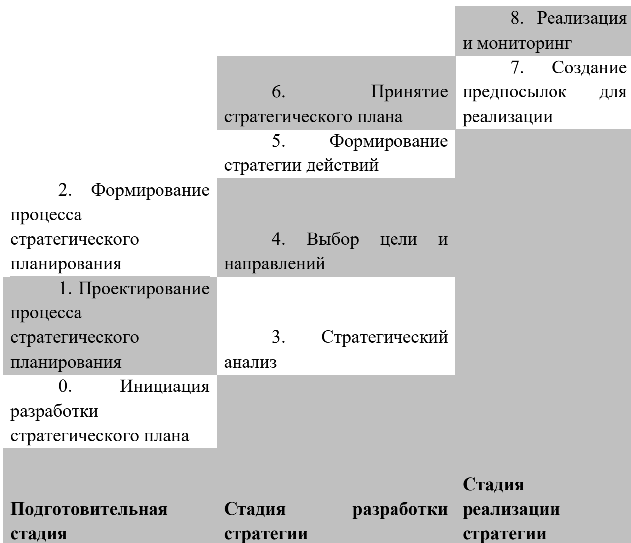
Рис 2. Стадии и этапы стратегического планирования экономических сетей

Методика. Методика стратегического планирования позволяет разработать стратегический план социально-экономического развития объекта, вести мониторинг стратегического плана и при необходимости позволяет вносить в планы отдельные уточнения и корректировать с учетом новых условий. Основными составляющими стратегического планирования являются: дерево проблем, дерево целей и дерево решений.