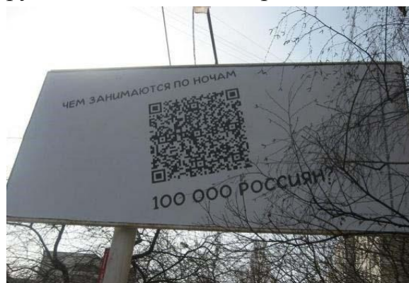
Рис.5 информационную нагрузку. Вербальный

Ниже приведены примеры, иллюстрирующие вытеснение традиционных компонентов креолизованного текста гиперкодом. При рассмотрении фотографии билборда на рис. 5 первое, что хочется прокомментировать, — отсутствие иконического компонента. Тем не менее возможно и следует говорить о семиотически осложненном, креолизованном тексте. Вербальная часть в данном случае не сможет существовать автономно от гиперкода, несущего основную