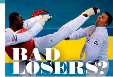
Adapted from a British newspaper