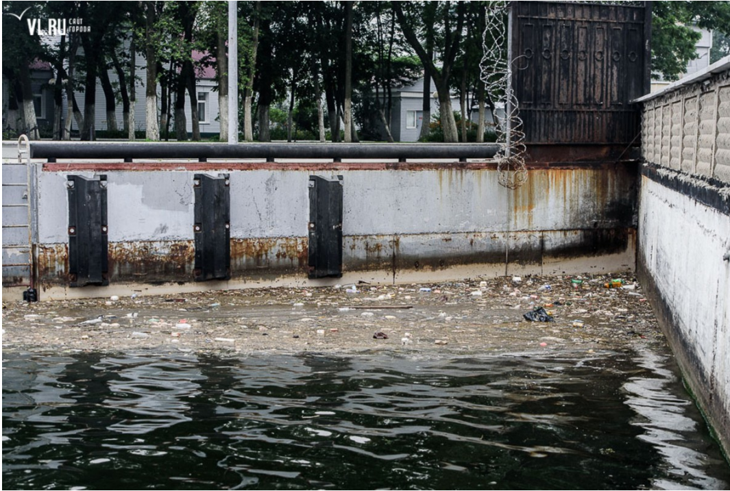
Рис.1 – Мусорное пятно в б. Золотой Рог в августе 2019 г.