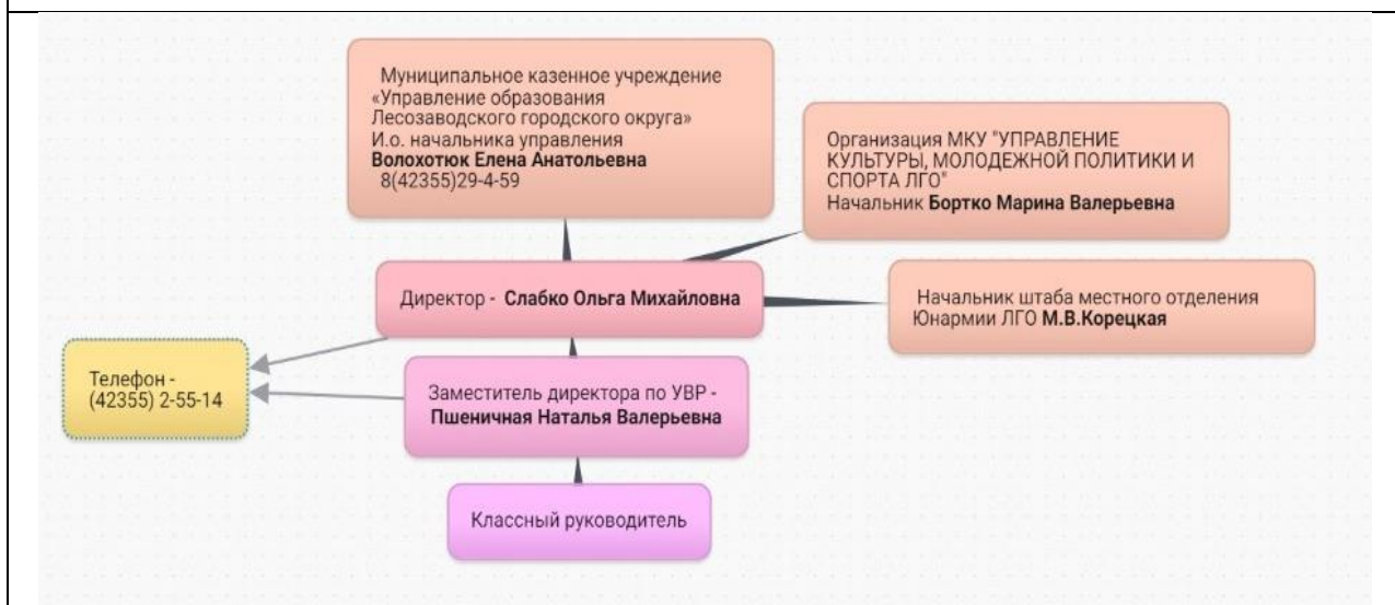
Рисунок 2 схема