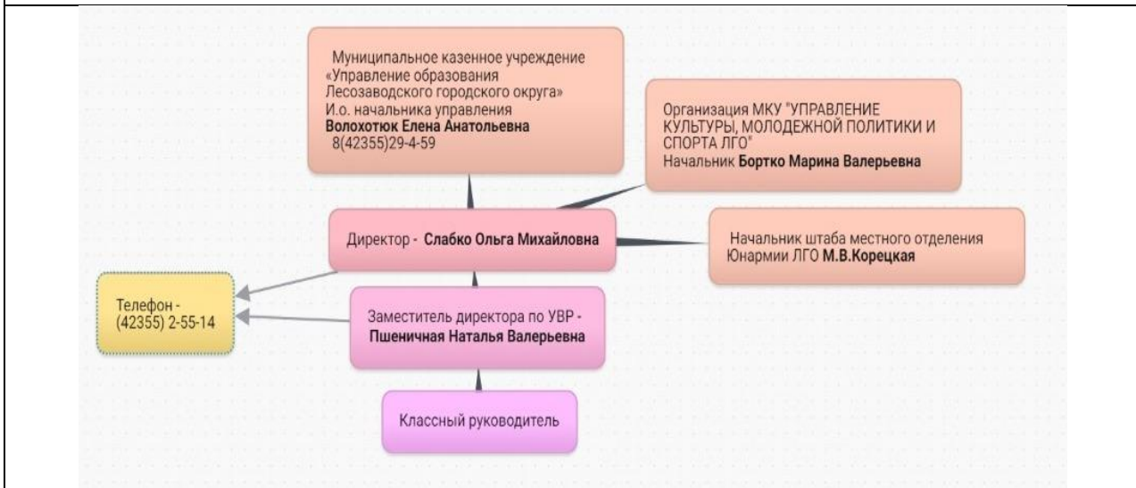
Рисунок 2 схема