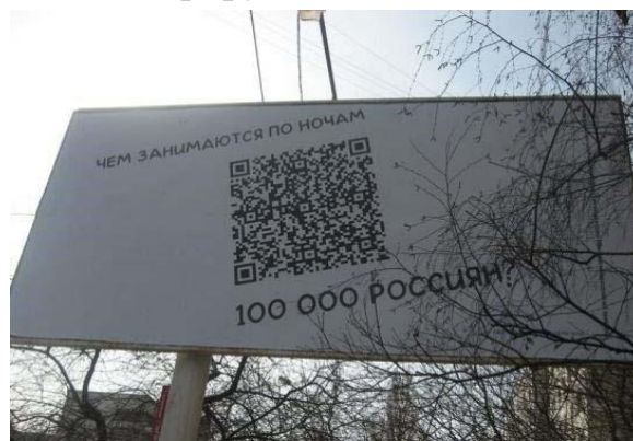
Рис. 5 информационную нагрузку. Вербальный

компонент призван лишь возбудить интерес адресата, в то время как полнота желаемой информации будет получена только после «прочтения» QR кода. С точки зрения рекламодателей, визуальная информация не нужна