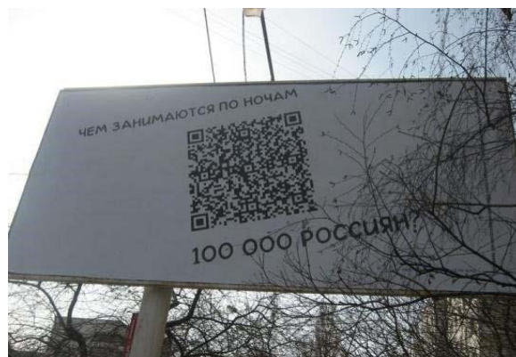
Рис.5 информационную нагрузку. Вербальный компонент призван лишь возбудить интерес адресата, в то время как полнота желаемой информации будет получена только после «прочтения» QR кода. С точки зрения рекламодателей, визуальная информация не нужна или, скорее всего, не может быть размещена из цензурных соображений. Но это не влечет за собой потери информативности, при использовании гиперссылки адресат узнает все необходимое.

Ниже приведены примеры, иллюстрирующие вытеснение традиционных компонентов креолизованного текста гиперкодом. При рассмотрении фотографии билборда на рис. 5 первое, что хочется прокомментировать, — отсутствие иконического компонента. Тем не менее возможно и следует говорить о семиотически осложненном, креолизованном тексте. Вербальная часть в данном случае не сможет существовать автономно от гиперкода, несущего основную