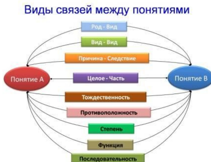
Рисунок 2: Виды логических связей между понятиями