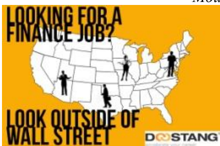
Мой круг, LinkedIn, Doostang