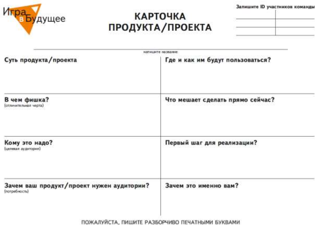
Рис 2 – Карточка продукта/ проекта

Команды расходятся по разным углам аудитории. Задача каждой команды — придумать описание продукта/проекта, который бы опирался на оба прогноза.