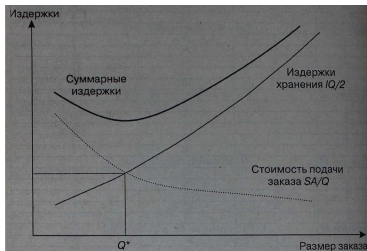
Рисунок 2 — Суммарные издержки на подачу заказа и хранение запаса: I — затраты на содержание единицы запаса, руб./шт.; Q — размер заказа, шт.; Q^* — оптимальный размер заказа, шт.; A — стоимость подачи одного заказа, руб.

Таким образом, графически уровень суммарных издержек в зависимости от размера заказа может быть представлен следующим образом (см. рис. 2).