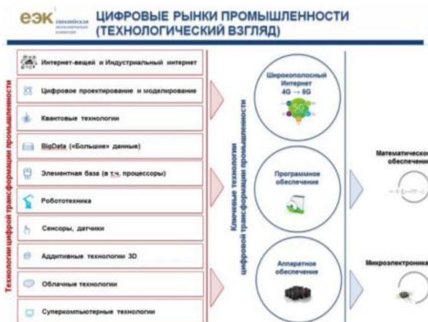
Рисунок 3 – Технологический подход 4

- определить технологию цифровой трансформации экономики, приемлемую для предприятия (рисунок 4) ;