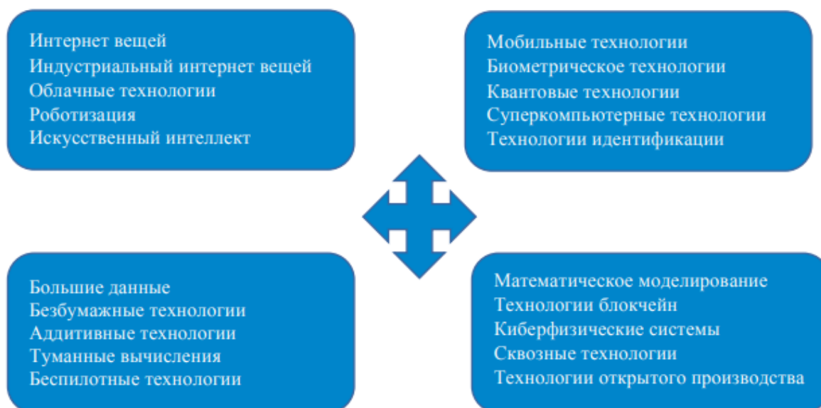
Рисунок 4 – Технологии цифровой трансформации экономики 4

- определить технологию цифровой трансформации экономики, приемлемую для предприятия (рисунок 4) ;