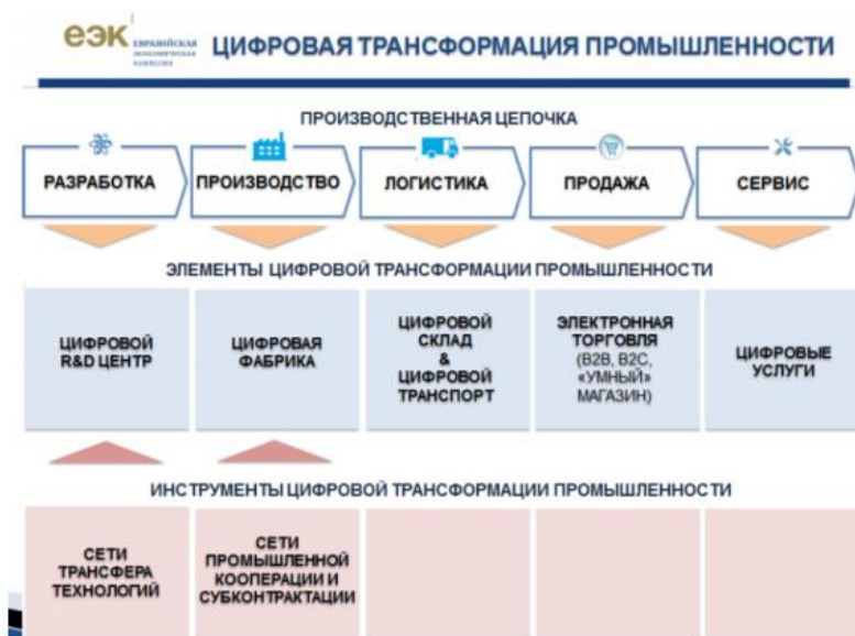
Рисунок 1 – Процессный подход 3

- определить отраслевой срез в рамках отраслевого подхода (рисунок 2) ;