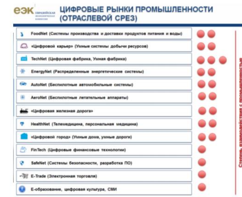
Рисунок 2 – Отраслевой подход 3

- определить отраслевой срез в рамках отраслевого подхода (рисунок 2) ;