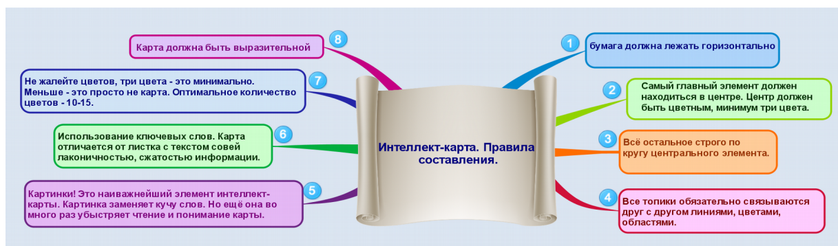
Диаграмма связей реализуется в виде древовидной схемы, на которой изображены слова, идеи, задачи или другие понятия, связанные ветвями, отходящими от центрального понятия или идеи. В основе этой техники лежит принцип «радиантного мышления», относящийся к ассоциативным мыслительным процессам, отправной точкой или точкой приложения которых является центральный объект (радиант — точка небесной сферы, из которой как бы исходят видимые пути тел с одинаково направленными скоростями, например, метеоров одного потока).