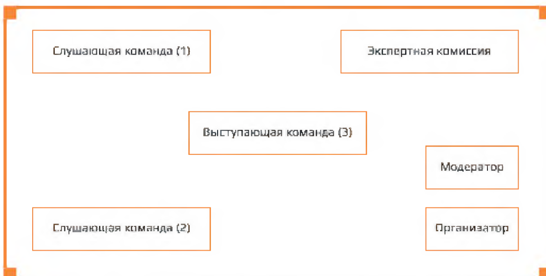
Примерная схема расположения участников защиты в аудитории