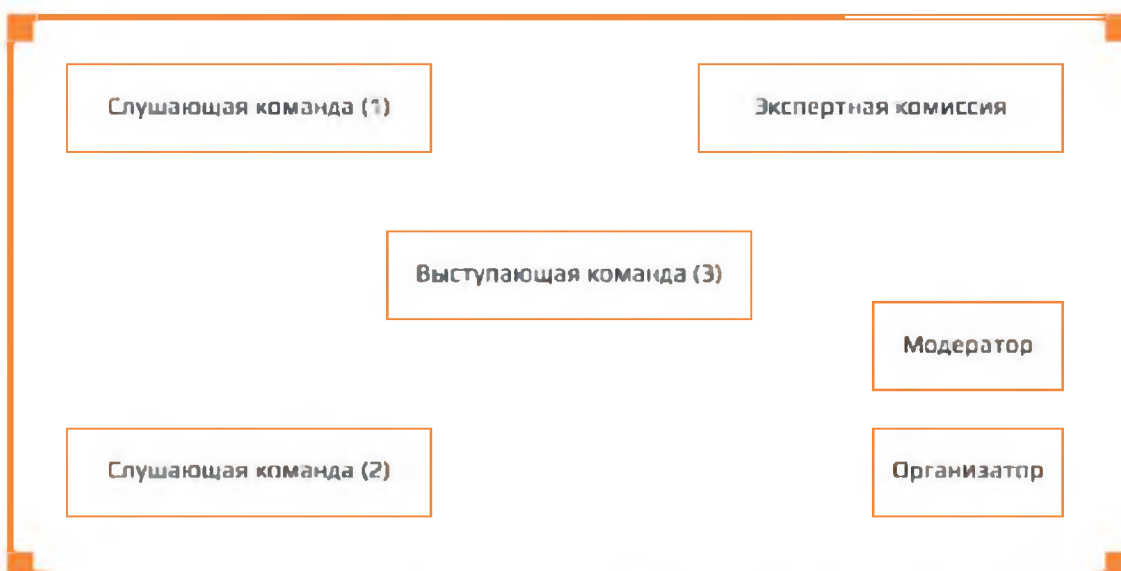
Примерная схема расположения участников защиты в аудитории

Выступающий докладывает результаты проекта Члены команды (за исключением руководителя проекта) отвечают на вопросы экспертной комиссии