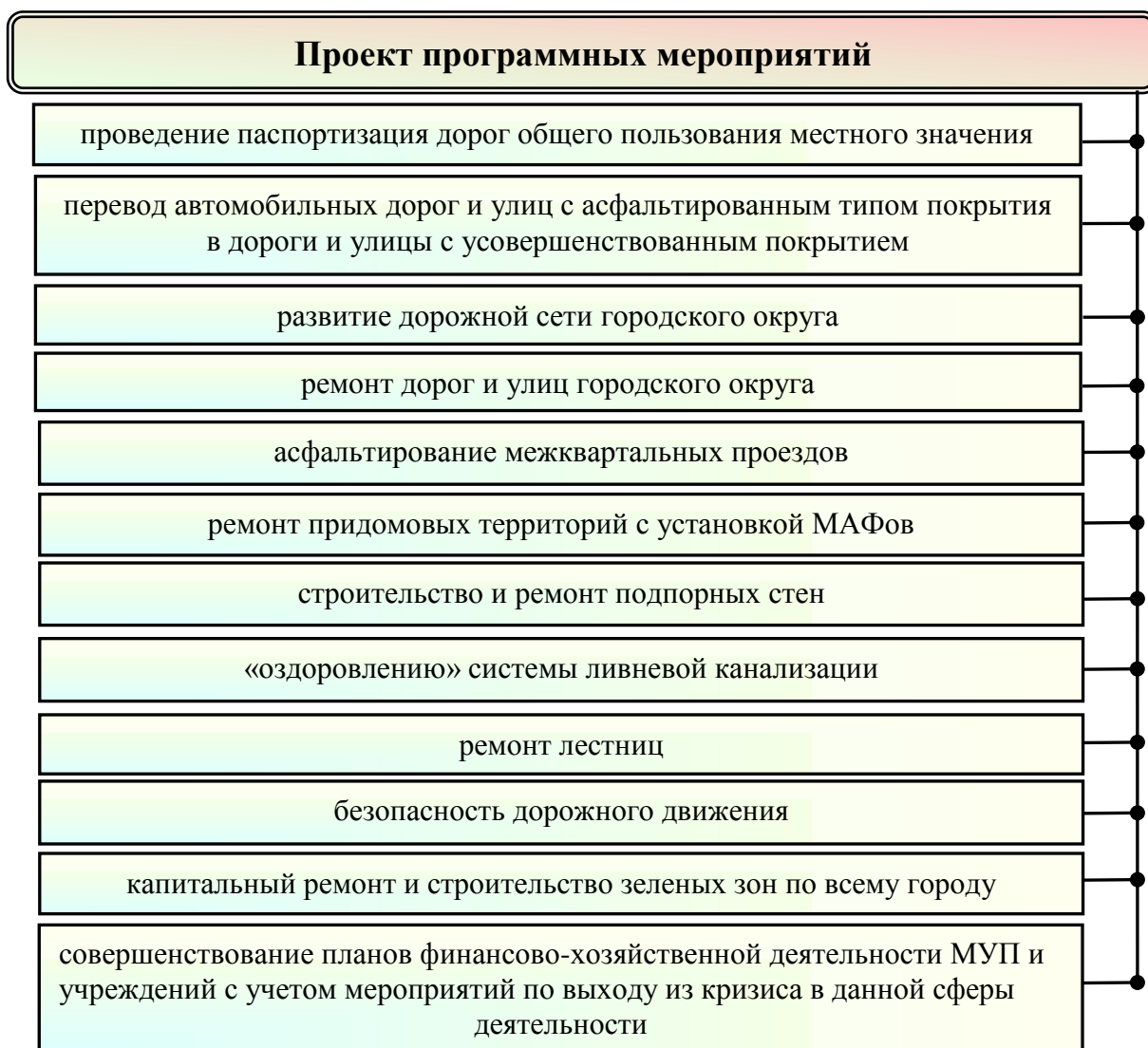
Рисунок 5 – Проект программных мероприятий по совершенствованию транспортно-эксплуатационного состояния автомобильных дорог и улиц городского округа

В общем виде предлагаемые программные мероприятия по совершенствованию транспортно-эксплуатационного состояния автомобильных дорог и улиц городского округа представлены на рисунке 5.