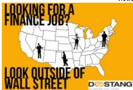
Мойкруг, LinkedIn, Doostang