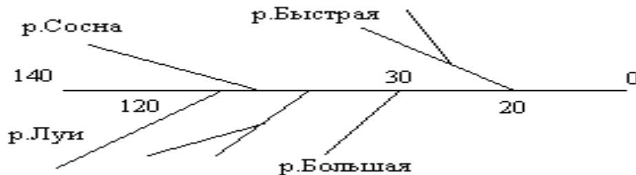
Рис.1. Гидрографическая схема р. Белой

второго, третьего и других порядков изображаются аналогично притокам первого порядка. Притоки подписываются на схеме. Длина притоков указывается в километрах.