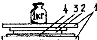
Рисунок 1 - Определение ВУС методом прессования

Навеску фарша массой около 0,3 г (взвешенную с погрешностью не более 0,01 г) поместить на предварительно взвешенный полиэтиленовый кружок и перенести последний на фильтр, положенный на плексигласовую пластинку (размером 10 на 10 см) так, чтобы навеска фарша лежала на фильтровальной бумаге (рис. 1).