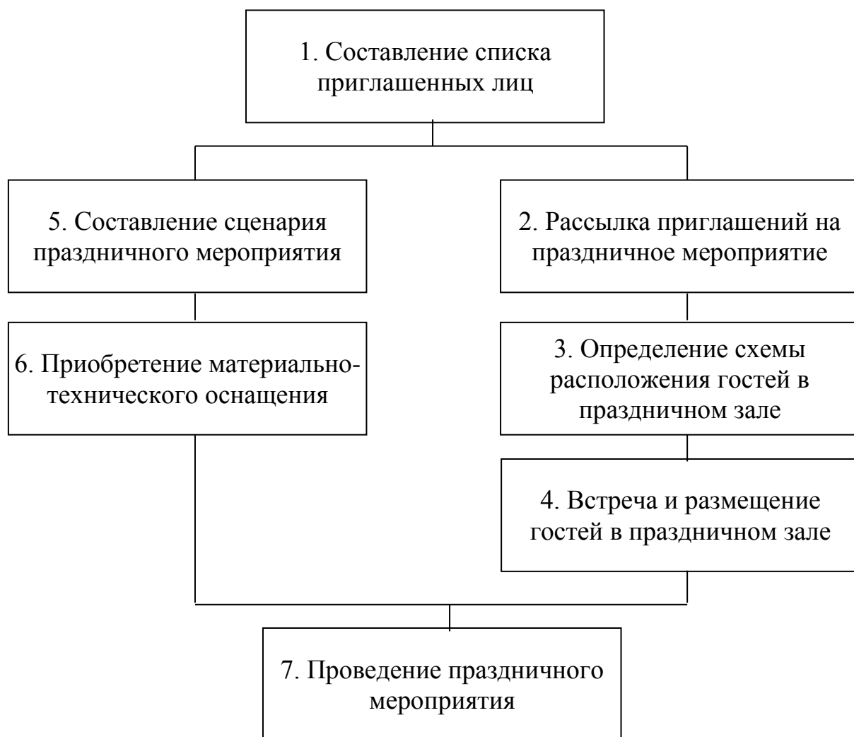
Рисунок. Алгоритм подготовки к проведению праздничного мероприятия