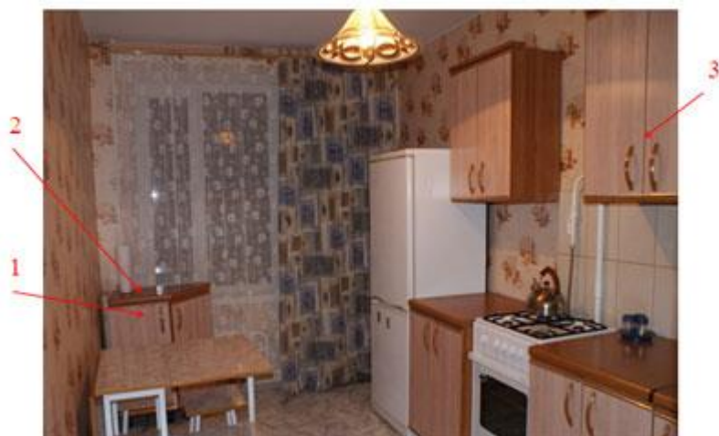
Рис. 1. Обстановка в комнате на момент осмотра. Стрелками красителем красного цвета указаны места обнаружения: 1 – 500 долларов США, 2 – видеомаягнитофон «Sony», 3 – пять колец из металла желтого цвета