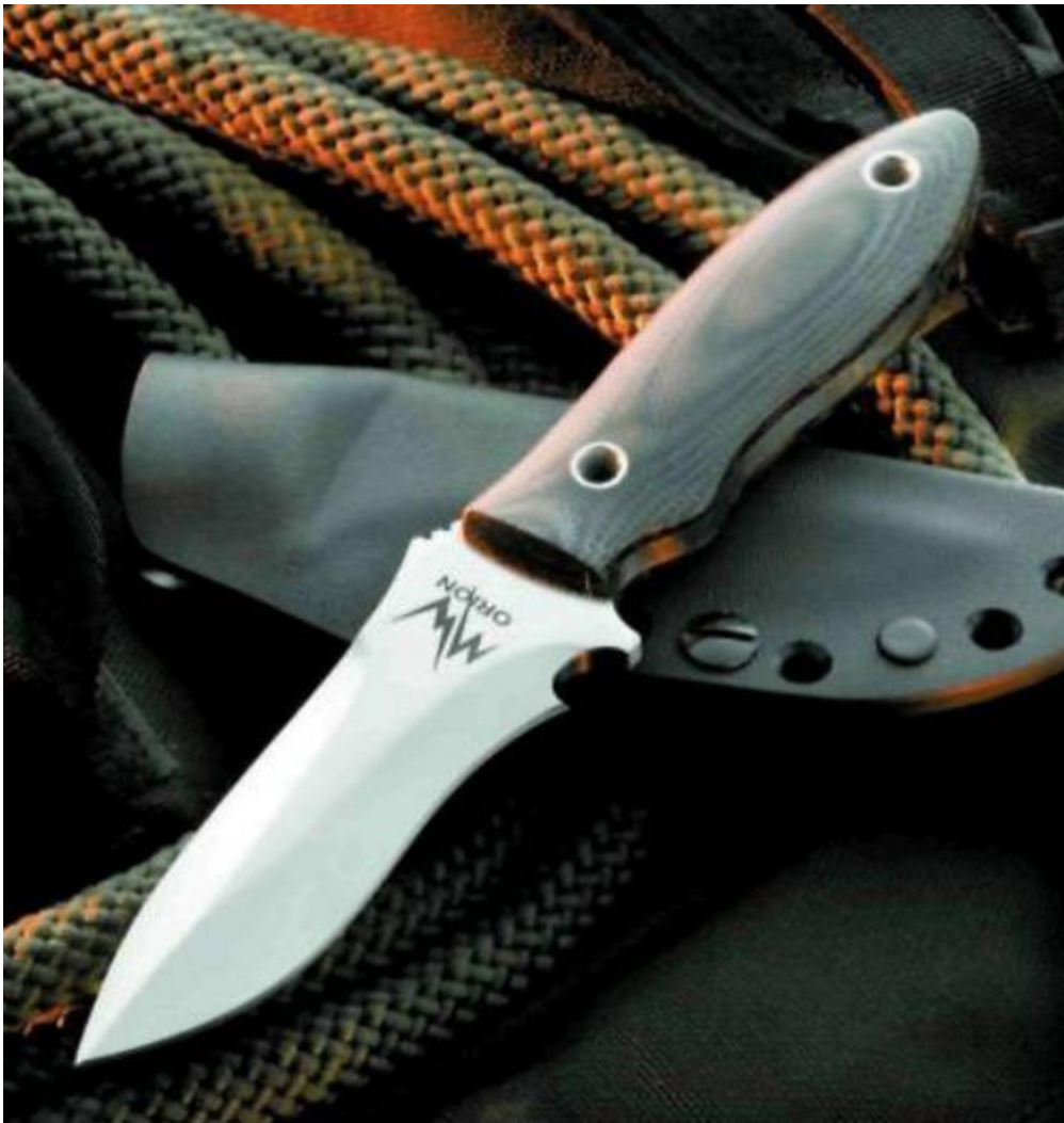
Рис. 2. Нож, изъятый у гр. Синицына А.П., изготовлен самодельным способом по типу охотничьих ножей и является холодным оружием.