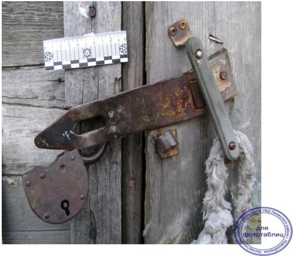
Рис 1. Входная дверь со следами взлома.

12 сентября 2011г. При осмотре квартиры гр. Бойко В.С. проживающего по адресу: Широкая ул., дом 4, кв. 2 установлено, что преступники проникли через входную дверь квартиры путем её взлома. Специалист-криминалист ГУВД Иванов В.В. сфотографировал по правилам масштабной фотосъемки следы орудия взлома на коробе входной двери, но поскольку слепочной массы для изъятия объемных следов у него не было, данные следы фиксировались только на фотопленку (рис. 1).