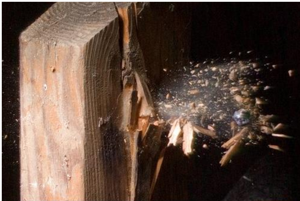
Рис. 2. Внешний вид повреждения в преграде

На основе представленной фабулы дела сформулируйте вопросы эксперту.