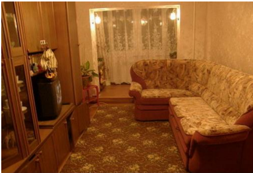
Рис. 1. Обстановка в комнате на момент осмотра

1,5 м от пола и 3,7 м от капель на полу по диагонали. Возле входной двери с внутренней стороны обнаружен след подошвенной части обуви, образованный наслоением почвы, максимальной длиной 25,5 см (рис. 1).