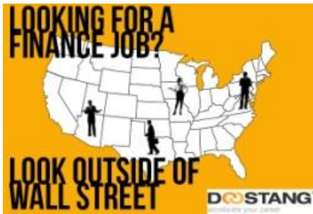
Мой круг, LinkedIn, Doostang