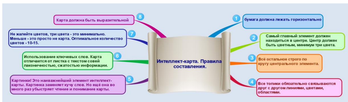
Диаграмма связей реализуется в виде древовидной схемы, на которой изображены слова, идеи, задачи или другие понятия, связанные ветвями,